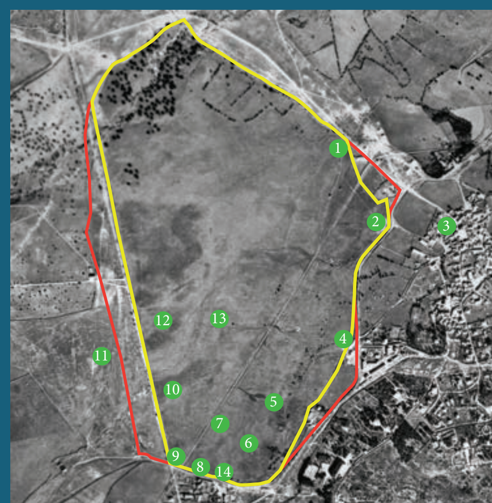
Vista aérea del vuelo americano II, 1956/1957.