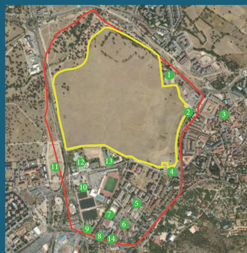
Vista aérea del vuelo PNOA, 2020.