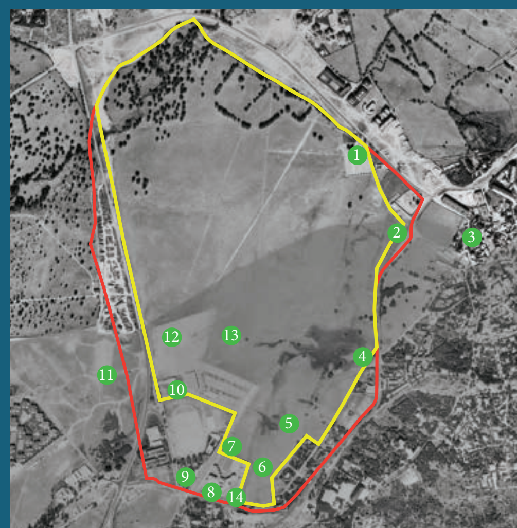
Vista aérea del vuelo interministerial, 1977.